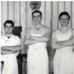
George Weston Bread & Cakes Ltd., St. Catharines, Ontario, vers 1940.