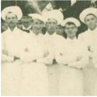
La boulangeire Model Bakery de George Weston, Toronto, vers 1897