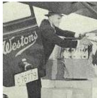
Envoi de pain Weston par avion jusqu'à l'île Amherst, prise dans les glaces, Est de l'Ontario, 1951.