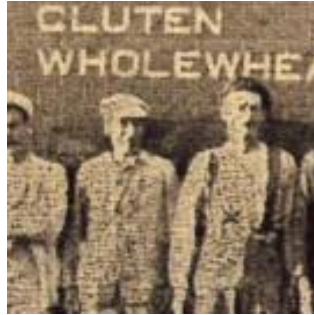
Ouvriers à la meunerie de la Model Bakery, Pickering, Ontario, 1902.