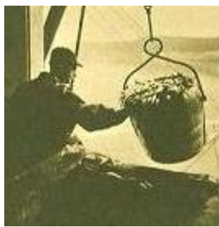
Ouvrier de la B.C. Packers, George Weston limitée, 1973.