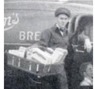
Le représentant pour le Pain Weston, Kingston, Ontario, durant les années 1940.