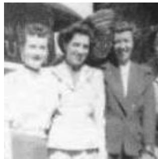
Personnel du service de la facturation de Weston, Montréal, vers 1950.