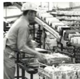
Chaîne de production, Weston Bakeries Limited, Toronto, 1974.